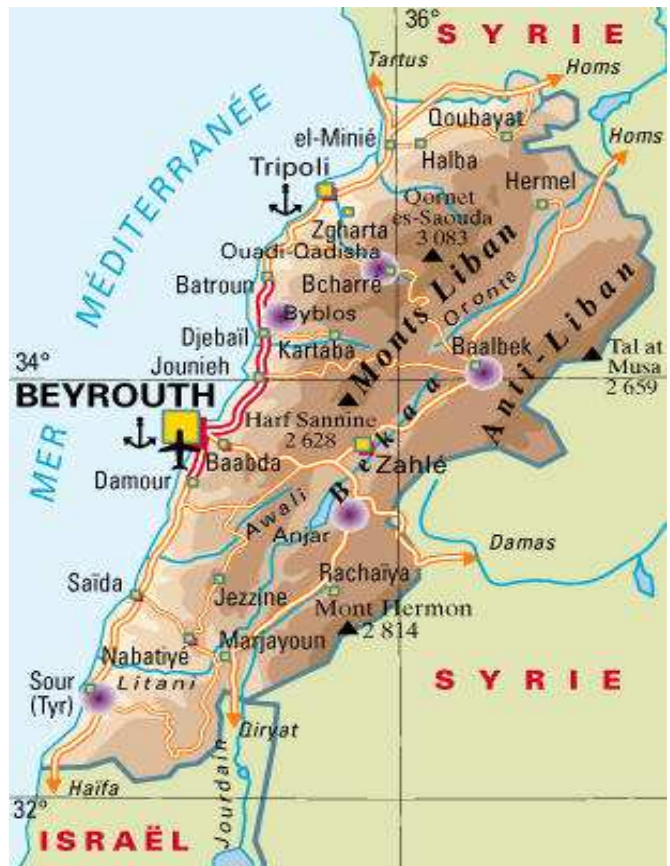
Carte n°2 : Répartition territoriale des communautés confessionnelles